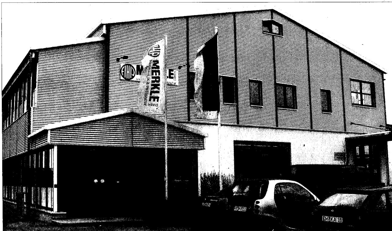
Bitter für March: Mit AHP Merkle wird der größte ansässige Gewerbebetrieb 2009 nach Gottenheim übersiedeln. Am Standort Hugstetten sieht sich der Hydraulikspezialist zu sehr beengt.