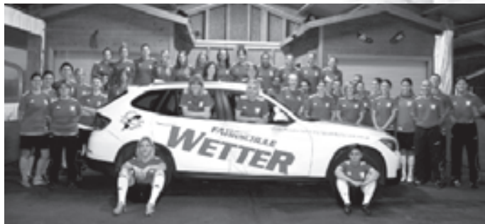
Fahrschule Uwe Wetter

Die Damenabteilung bedankt sich bei den Sponsoren Fahrschule Uwe Wetter und Malerbetrieb Michael Ambs für die neuen Aufwärmshirts.