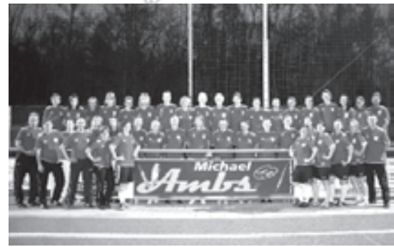
Malerbetrieb Michael Ambs