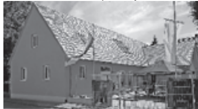
Veranstalter: Musikverein Gottenheim e.V. c/o 07665/8429

Gemeindehaus St. Stephan, bei jedem Wetter!