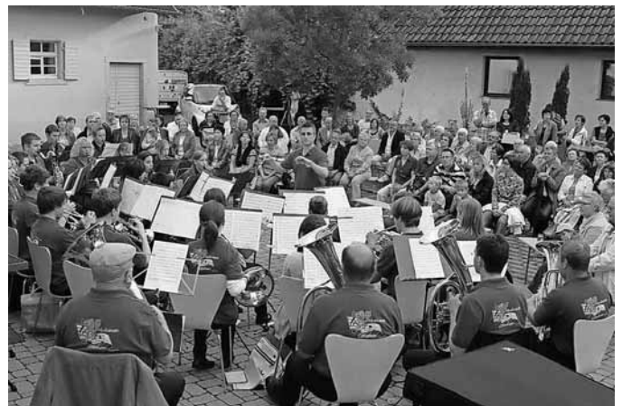
35 Musikerinnen und Musiker, ein Dirigent und viele gespannte Zuhörer - das Korea-Konzert des Musikvereins Gottenheim im Rathaushof am vergangenen Sonntag war geprägt von Vorfriede auf die Reise.

Am 25. August steigt die Reisegesellschaft aus Gottenheim in Seoul ins Flugzeug, um die Heimreise anzutreten. Was die Musikerinnen und Musiker sowie ihre Begleiter bis dahin in Südkorea erleben, können Interessierte in einem eigens dafür eingerichteten Reise-Blog nachlesen, der im Internet unter der Adresse www.mvgottenheim-korea.blogspot.com zu finden ist.