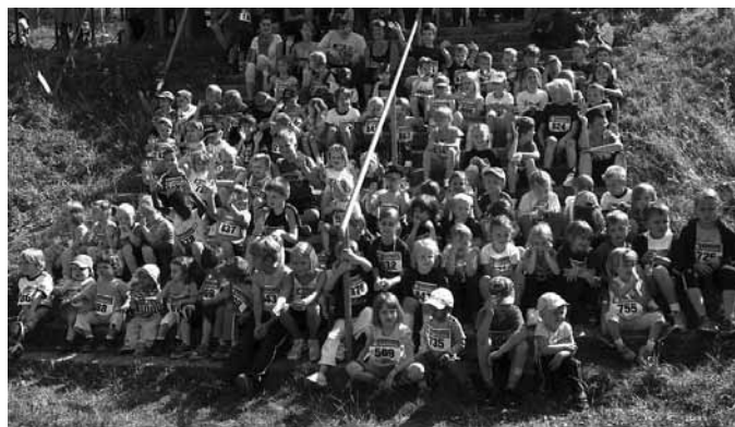
34 Kinder vom SV Gotthenheim und 77 Kinder vom VfR Umkirch

Jung und alt hat es wieder viel Freude gemacht und freuen sich mit uns auf den nächsten Lauf 2012.