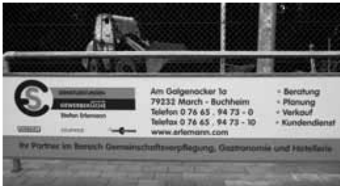
Die neue Bande der Firma Erlemann, Am Galgenacker 1 a in 79232 March-Buchheim