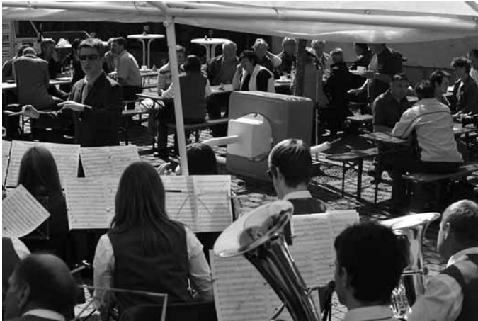
Frühlingshock der Badenova