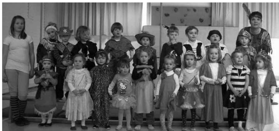
Mittwochsturnkinder 3 bis ca. 4 ½ Jahre