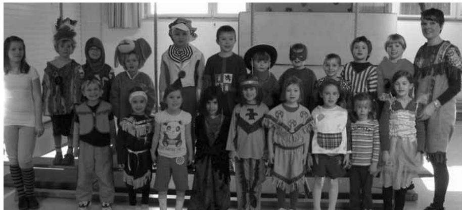
Mittwochsturnkinder 4 ½ Jahre – 6 Jahre