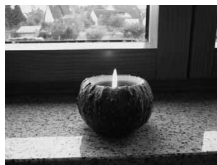
Eure BE-Gruppe „Gottenheims Kinder“