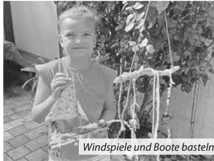
Windspiele und Boote basteln

Am nächsten Tag konnten die älteren Schulkinder beim Handy-Fotoworkshop kreativ werden. Gemeinsam mit dem Fotografen Mirko Waldschmidt war die Gruppe mit ihren Handys auf Motivsuche auf dem Schulhof unterwegs. Anschließend haben sie gemeinsam die Bilder über den Beamer an der Leinwand angeschaut,