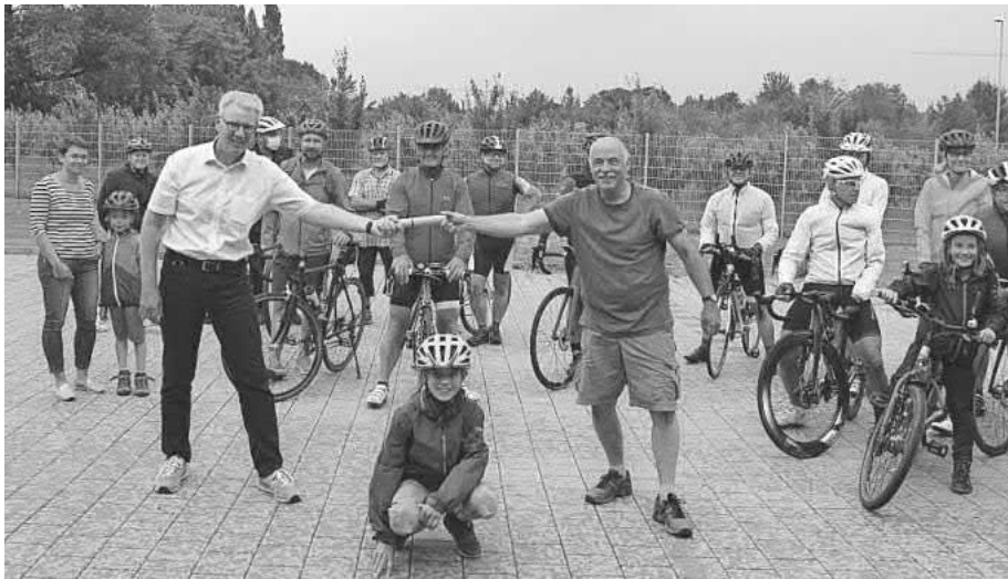
Stabübergabe an die Gemeinde Bötzingen

Jahr machen wir vielleicht wieder beim Stadtradeln mit. Mir hat die unkomplizierte Aktion, bei der jeder nach seinen eigenen Kräften mitmachen konnte, jedenfalls gro-